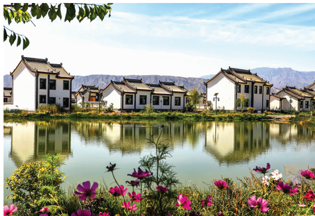
甘州区甘浚镇高家庄村

突出聚集群、延链条。 聚焦“土特产”，充分挖掘乡村产业资源潜力，持续培育壮大现代种业、绿色蔬菜、优质奶业、优质肉牛、特色种养五大产业集群，形成70万亩制种玉米、42万亩绿色蔬菜、23万吨鲜奶、47万头优质奶肉牛、10万亩特色种植等产业规模，农业产业迈上布局区域化、种养标准化、生产规模化发展轨道。按照“接二连三、农头工尾、粮头食尾、畜头肉尾”方向，加快发展以预制菜、乳制品、优质牛肉等为主的精深加工，培育壮大前进牧业、神农菇业、甘肃云鑫等一批市场前景好、经营规模大、带动能力强的龙头企业，优势特色产业链和